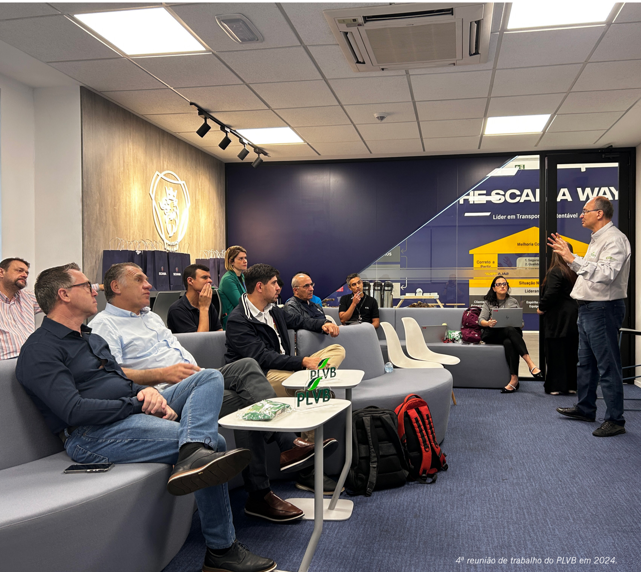
4ª reunião de trabalho do PLVB em 2024.